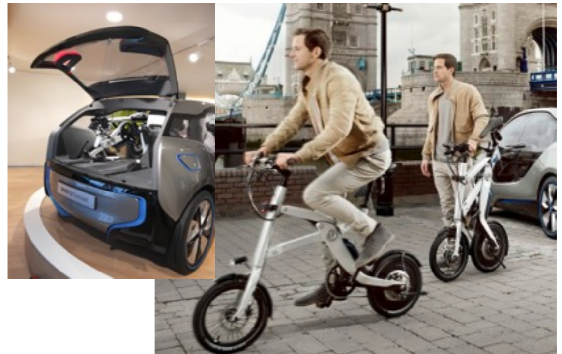
BMW i3 (EV/PHEV)