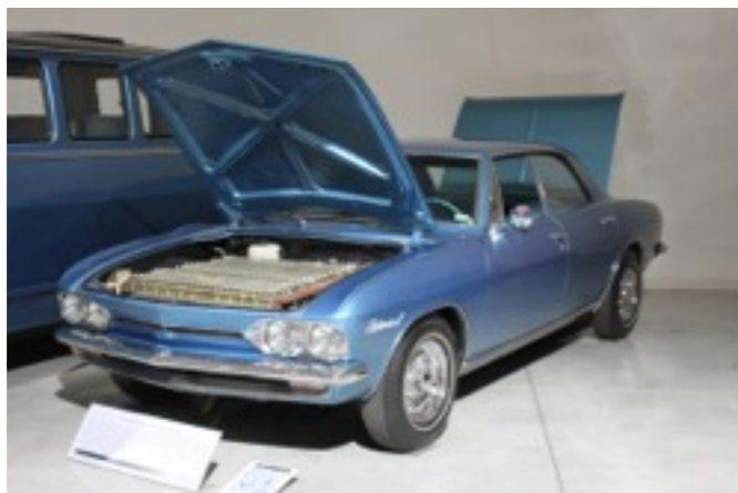
1966年製 PHV GM エレクトロヴェア 116.6ps/巡行距離は64~128マイル