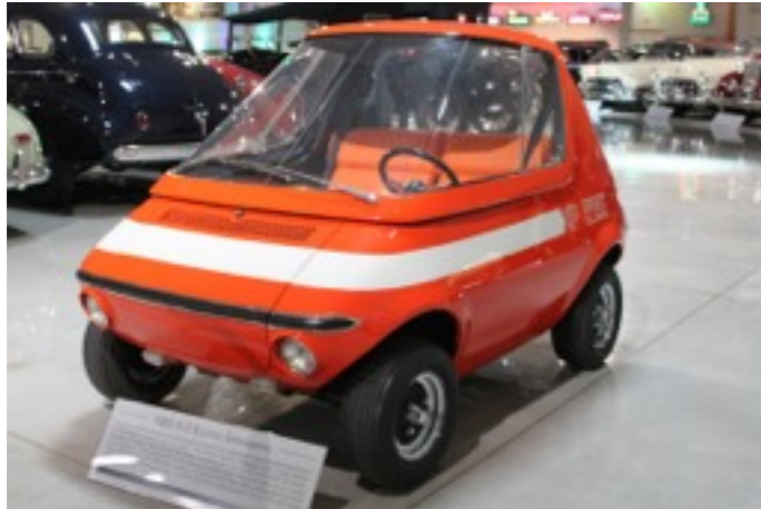
1969年製 2人乗りの超小型EV GM 512エレクトリック・エクスペリメンタル 7時間充電、92.8km/h走行にて巡行距離は25マイル