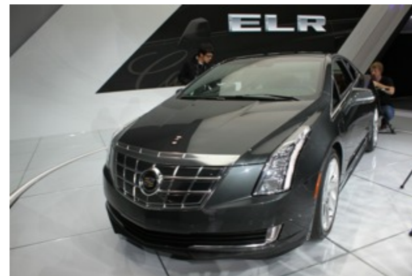
キャディラックELR 高級車ブランドのPHV