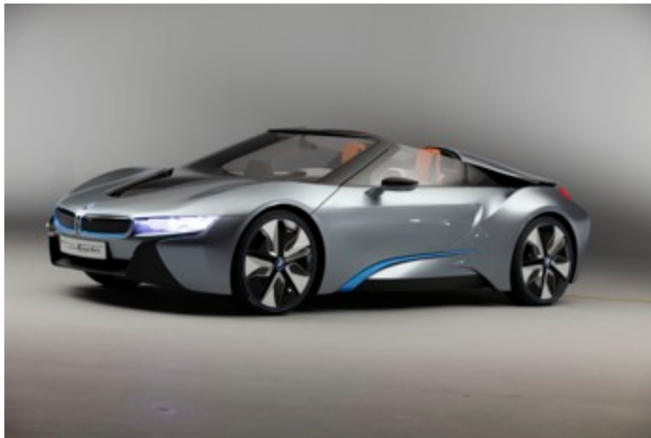
BMW i8スパイダー (PHEV)