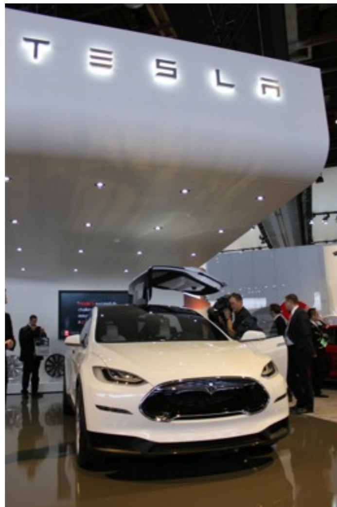
テスラ・モデルX SUV風の外観に3列シート