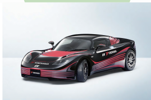
旅の前後には、EVスーパーセブンが東京周辺などでアピールランを実施。横浜ゴムが製作したオリジナルEVの「AERO-Y」とランデブーします。