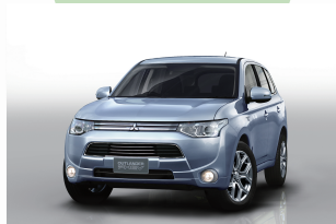
世界初のPHEVとして登場した「アウトランダー PHEV」が、サポートカーとしてEVスーパーセブンと一緒に全国を走ります。