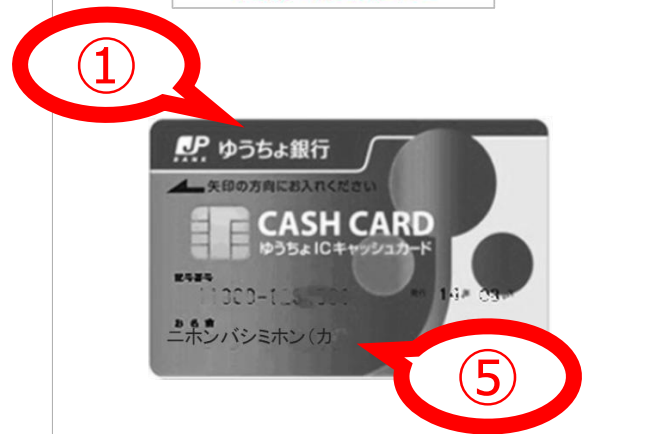
キャッシュカードのコピー

※通帳やキャッシュカード等で口座情報の記載がない場合、ゆうちょ銀行のHPで振込番号を確認した画面と併せて提出してください。